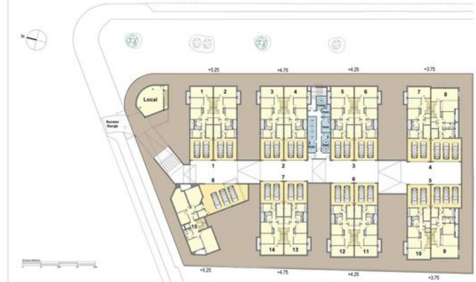
Planta sótano Basement Floor Подвальный этаж

Costo para el primer año y está sujeto a posibles modificaciones