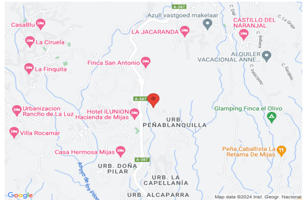
Map data ©2024 Inst. Geogr. Nacional