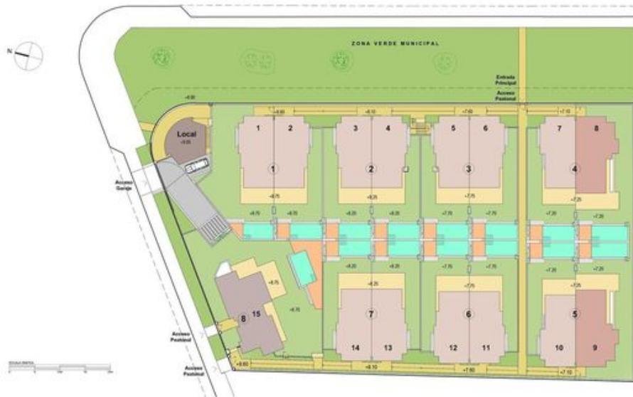
Plano de Conjunto Master Plan Генеральный план

Plano sujeto a posibles modificaciones por razones o exigencias de índole técnica o jurídica. Las superficies son aproximadas. Cotas y asentamientos orientados de valor contractivo. Plans subject to possible modifications for technical or legal reasons. Measurements shown are approximate. Kitcher and finishing are for display purposes only, with no contractual value. План с учетом возможных изменений по техническим или юридическим причинам. Показаны приблизительные площади. Котировки и планировки не являются контрактными.