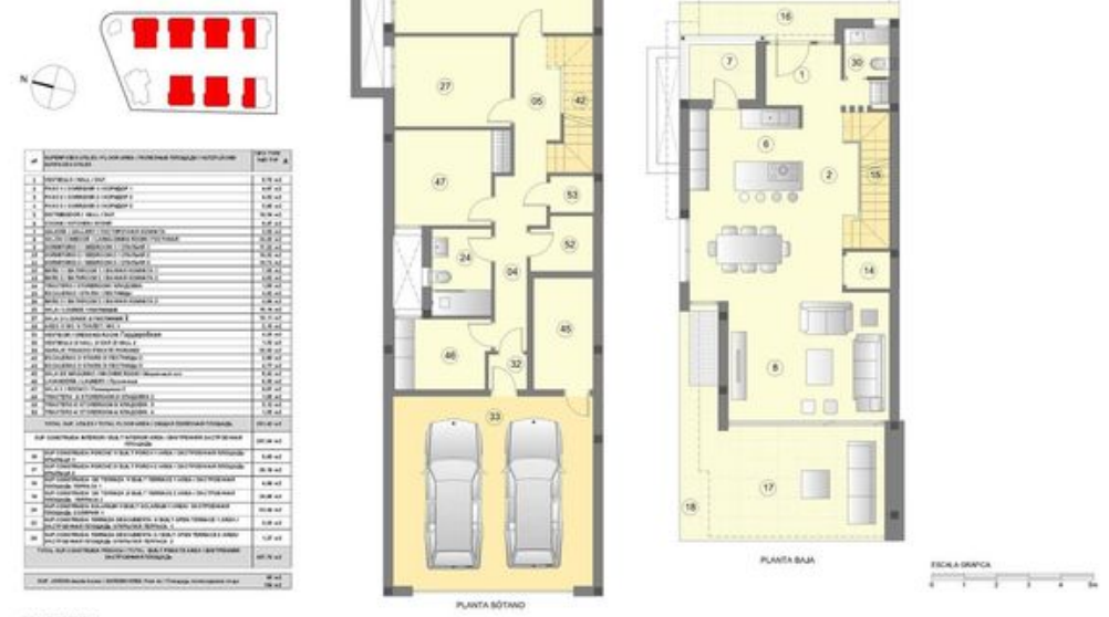
TIPO / TYPE / ТИП А VILLA PARRADA 3 3 Dormitorios + 4 baños ТОРИНСКОЕ 3 3 bedrooms + 4 bathrooms ТОРИНСКОЕ 3 3 спальни + 4 ванные

Plano sujeto a posibles modificaciones por razones o exigencias de índole técnica o jurídica. Las superficies son aproximadas. Cotas y asentamientos orientados de valor contractivo. Plans subject to possible modifications for technical or legal reasons. Measurements shown are approximate. Kitcher and finishing are for display purposes only, with no contractual value. План с учетом возможных изменений по техническим или юридическим причинам. Показаны приблизительные площади. Котировки и планировки не являются контрактными.