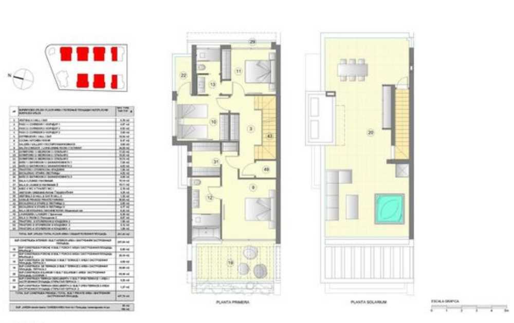
TIPO: TIPO 1 (SET) A VILLA PARADA 3 3 Bedrooms + 4 baths TOWNHOUSE 3 Bedrooms + 4 bathrooms ТОПОВИЦ 3 спальных комнаты + 4 ванные

Plano suple a possible modifications for technical or legal reasons. Measurements shown are approximate. Kitchen and landing are for display purposes only, with no contractual value. План с вариантами изменений по техническим или юридическим соображениям. Измерения и планировка кухни и прихожей не являются contractual value.