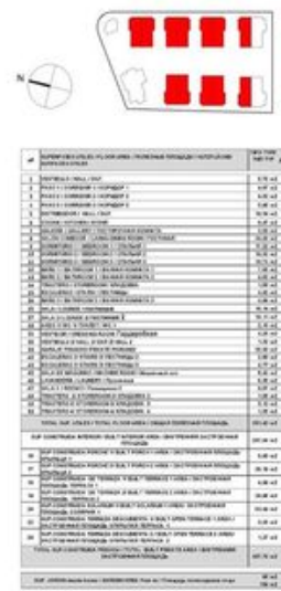
TIPO: TIPO 1 (SET) A VILLA PARADA 3 3 Bedrooms + 4 baths TOWNHOUSE 3 Bedrooms + 4 bathrooms ТОПОВИЦ 3 спальных комнаты + 4 ванные

Plano suple a possible modifications for technical or legal reasons. Measurements shown are approximate. Kitchen and landing are for display purposes only, with no contractual value. План с вариантами изменений по техническим или юридическим соображениям. Измерения и планировка кухни и прихожей не являются contractual value.